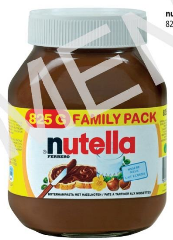
nutella 825 g