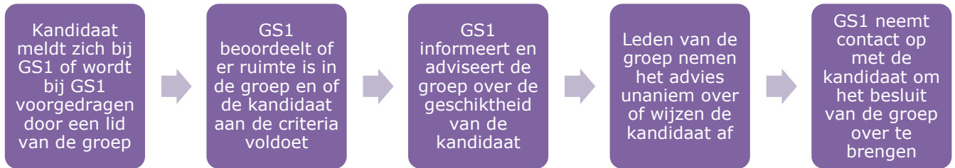
Figuur 2.1: Proces voor nieuwe leden