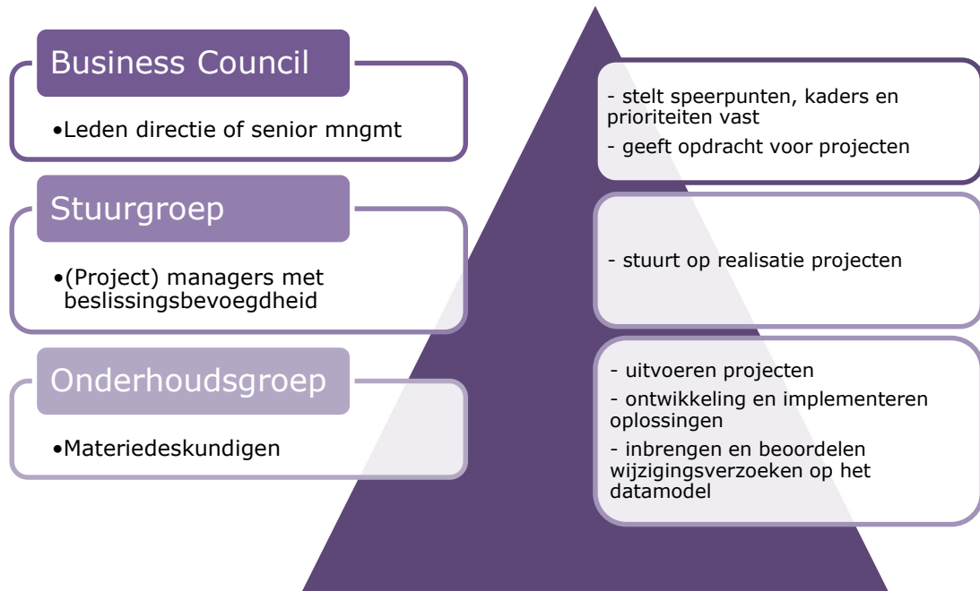
Figuur 1.1: Rollen en verantwoordelijkheden deelnemersorganisaties

De algemene rollen en verantwoordelijkheden voor de verschillende groepen van de sector Doe-Het-Zelf, Tuin & Dier in de Benelux zijn de volgende: