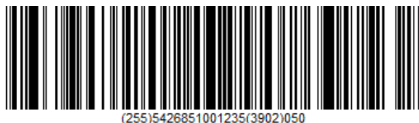
GS1 Databar Expanded Stacked